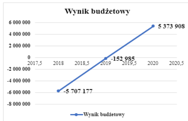
Rys. 2. Wynik budżetowy gmin w Polsce w latach 2018-2020.

Rys. 2., który znajduje się poniżej prezentuje, jak kształtował się wynik budżetowy (w tysiącach złotych) wszystkich gmin znajdujących się na terenie Polski w latach 2018-2020.